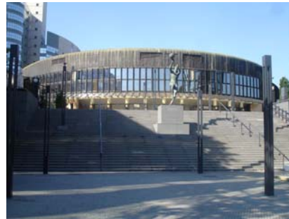
Košarkaški centar „Dražen Petrović“