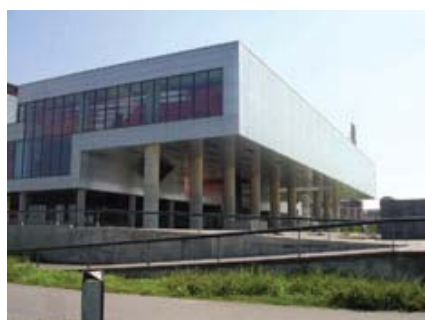
Muzej suvremene umjetnosti

Sveučilište u Zagrebu najstarije je sveučilište s neprekinutim djelovanjem u Hrvatskoj i među najstarijima u Europi, te je 2009. godine proslavilo 340 godina postojanja. Sveučilište u Zagrebu danas čini 29 fakulteta, 3 akademije, jedan interdisciplinarni studij i jedan sveučilišni centar. Od fakultetskih ustanova pristupačnih osobama s invaliditetom samo neke su: Filozofski fakultet, Fakultet političkih znanosti, Tekstilno-tehnološki fakultet, Fakultet političkih znanosti, Edukacijsko-rehabilitacijski fakultet, Učiteljski fakultet, Prirodoslovno-matematički fakultet, Šumarski fakultet, Agronomski fakultet, Tehničko veleučilište, Studentski centar.