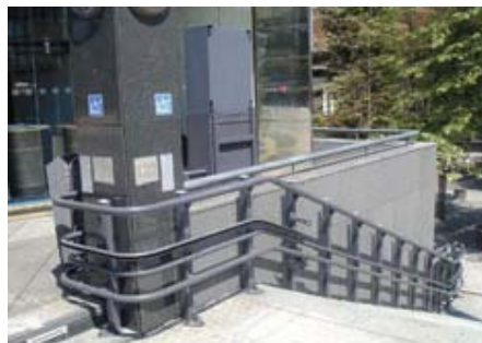
Muzejsko-memorijalni centar „Dražen Petrović“