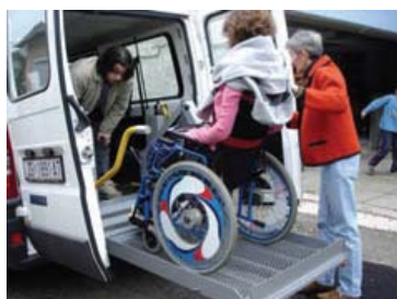
ZET – Odjel za prijevoz OSI