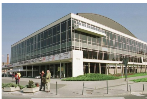
Koncertna dvorana Vatroslava Lisinskog

Zagreb kao znanstveni i kulturni centar, ima niz znanstvenih institucija na područjima društvenih i prirodnih znanosti, njih čak dvadeset i dvije. Grad Zagreb je i sjedište Hrvatske akademije znanosti i umjetnosti (HAZU). Metropola Hrvatske obiluje kulturnim sadržajima, te se u Gradu nalazi veliki broj muzeja, galerija i kazališta s bogatim programom tijekom cijele godine. Zagreb je najveće kulturno središte Hrvatske u kojem se nalaze ustanove koje tradicionalno imaju veliki prestiž. U glazbi je to, svakako, Koncertna dvorana Vatroslava Lisinskog (prilagođena za osobe s invaliditetom), glede kazališta, baleta i opere Hrvatsko narodno kazalište, a među knjižnicama Nacionalna i sveučilišna knjižnica. Najposjećeniji muzej U Gradu Zagrebu je Muzej suvremene umjetnosti otvoren 2009. godine na području Novog Zagreba, također prilagođen osobama s invaliditetom.