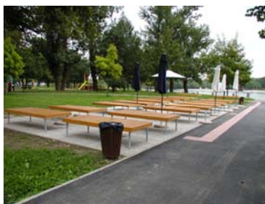
Sunčalište za OSI Jarun