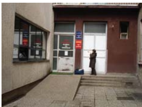
KBC Sestre milosrdnice