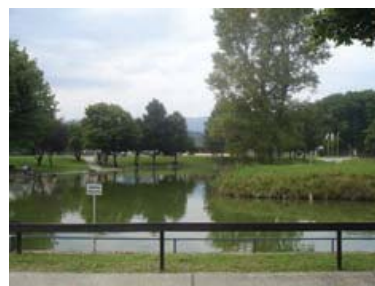
Ribolovno područje za OSI, Jezero „Granešina“