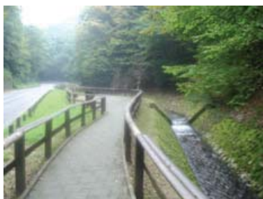
Šumska staza za OSI „Bliznec“