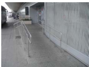
Zračna luka Zagreb

Zagreb se nalazi u kontinentalnoj središnjoj Hrvatskoj, na južnim obroncima Medvednice, te na obalama rijeke Save. Jedna od njegovih karakteristika je i povoljan prometni položaj, poveznica je Srednje i Jugoistočne Europe te Jadranskog mora. Bitno je izdvojiti autoceste: A3 Bregana–Zagreb-Lipovac, A1 Zagreb-Split i A6 Zagreb-Rijeka. Važan kompleks je i Zračna luka Zagreb (prilagođena osobama s invaliditetom) sa statusom međunarodne zračne luke i jedne od najprometnijih točaka u zemlji. Povezana je sa svim važnijim europskim središtima, a nalazi se u naselju Pleso pokraj Velike Gorice. Zagreb je, također, i veliko željezničko čvorište. Dva od tri najvažnija europska koridora u Hrvatskoj prolaze kroz Zagreb. Prilagodba željezničkog prometa za osobe s invaliditetom je u tijeku. Glavninu javnog prijevoza u Zagrebu obavlja Zagrebački električni tramvaj (ZET) čiji su niskopodni autobusi i niskopodni tramvaji prilagođeni za osobe s invaliditetom. Osnivanjem Odjela za prijevoz osoba s invaliditetom 1994. godine, ZET je olakšao prijevoz osobama s invaliditetom na posao, fakultete, u školu, na rekreaciju i terapiju. Danas je na raspolaganju 10 specijaliziranih kombi vozila za odrasle osobe s invaliditetom, te 7 vozila za djecu s poteškoćama u razvoju.