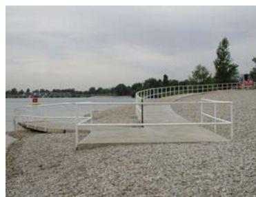
Kupalište za OSI Jarun